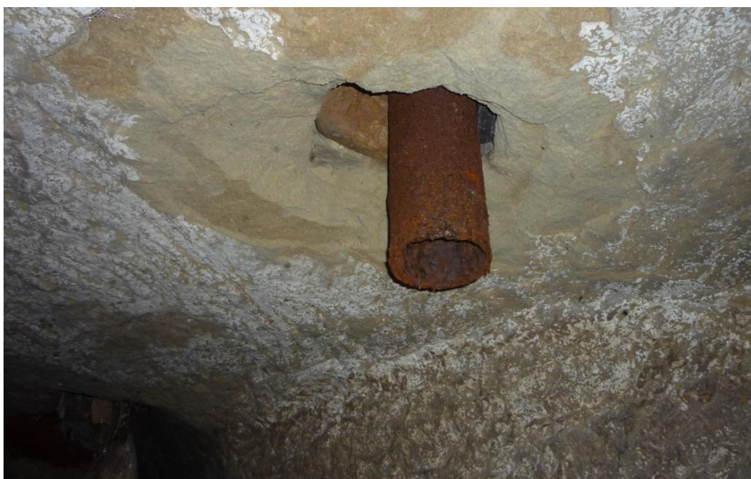
Foto č. 12 – Sklep B, pata stožáru EO (viz foto č. 3) - říjen 2019.