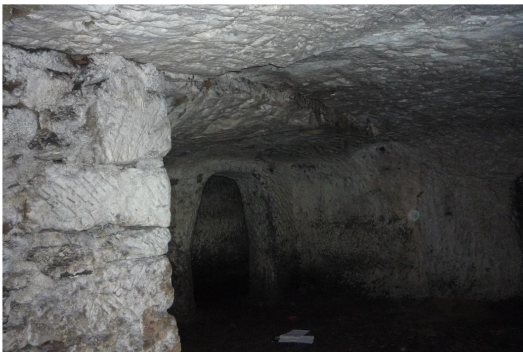
Foto č. 33 – Sklep E, výrazná dislokace s poklesem horninového bloku.