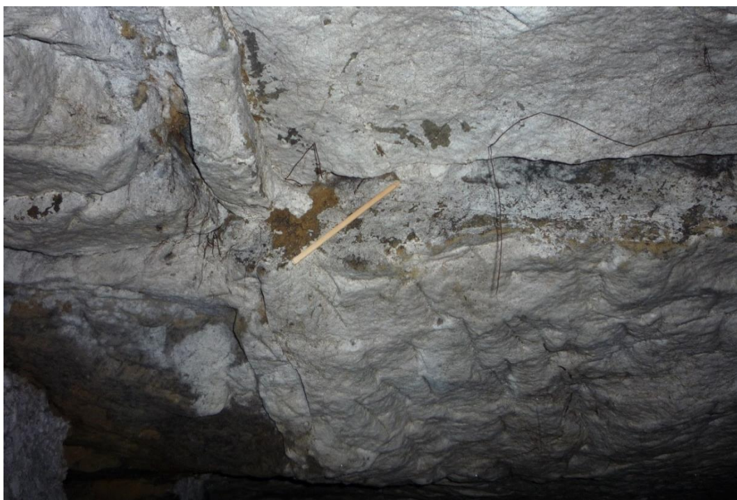
Foto č. 26 - Sklep E, výrazná dislokace ve stropu.