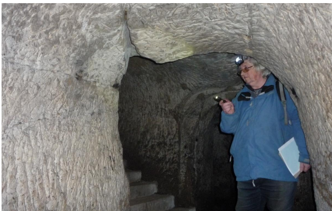
Foto č. 6 – Vstupní partie (A), puklina ve stropě a vrstevní spáry.