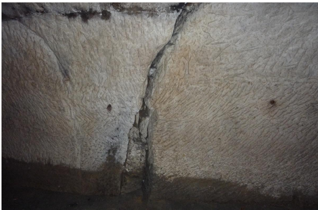
Foto č. 49 - Rozevřená subvertikální puklina ve stěně sklepa F.