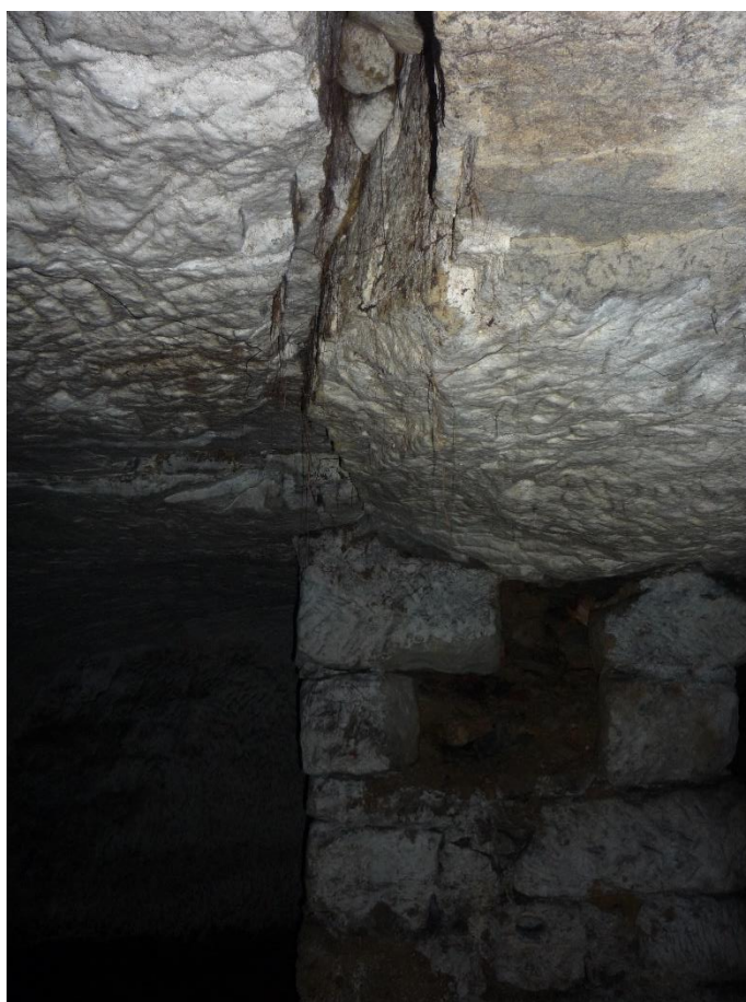
Foto č. 30 – Sklep E, opěrný pilíř situovaný na křížení výrazných dislokací.