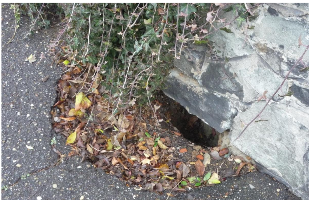
Foto č. 2 – Propad u větracího otvoru, Nerudova ulice (stav 2019).