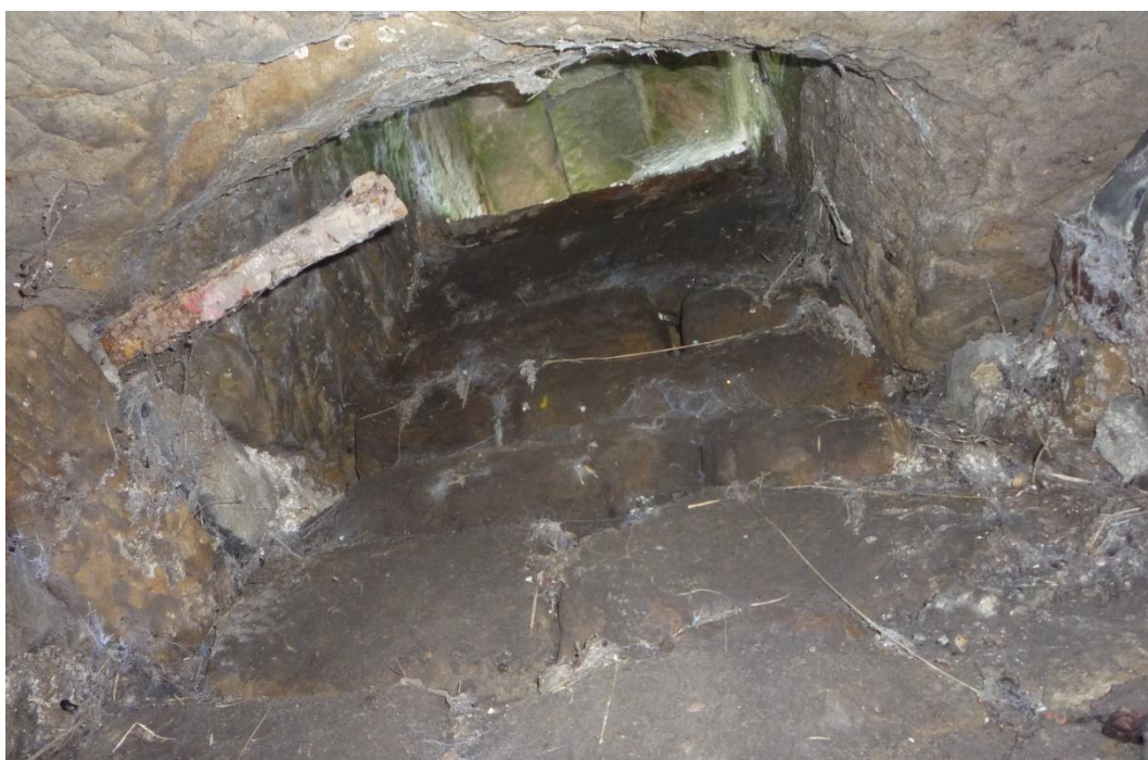
Foto č. 44 – Větrací otvor do ulice v chodbě mezi sklepy E a F (srpen 2020).