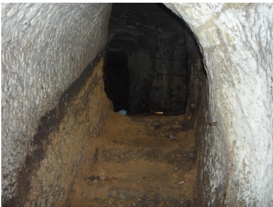
Foto č. 37 a 38 - Schody ve spojovací chodbě mezi sklepy E a F (srpen 2020).

Na stěnách je patrná úroveň odstraněných odpadů.