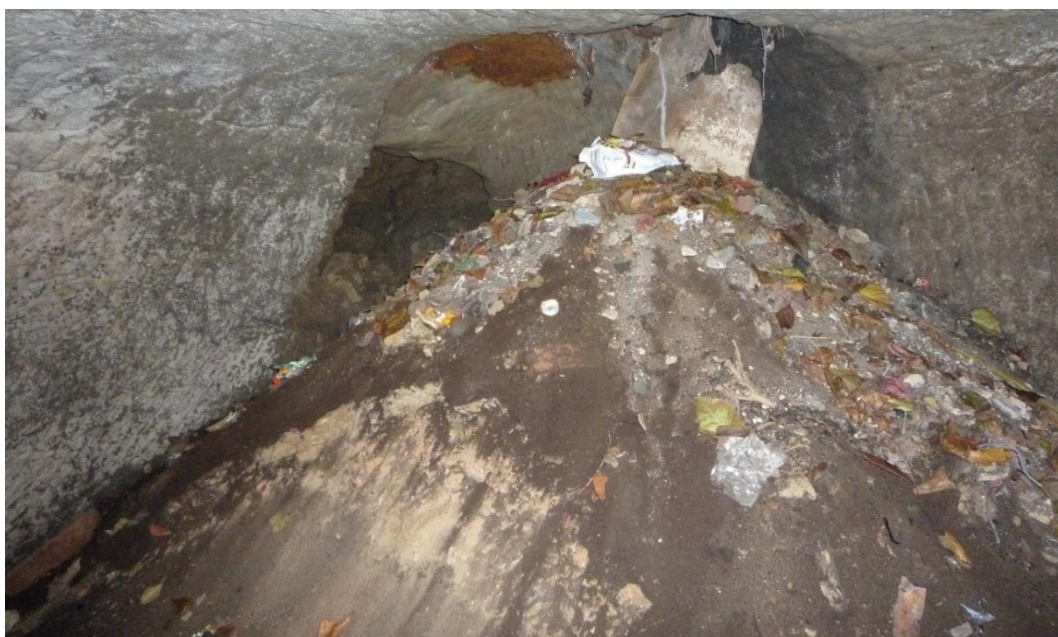
Foto č. 13 – Sklep B, kužel komunálního a stavebního odpadu – říjen 2019.