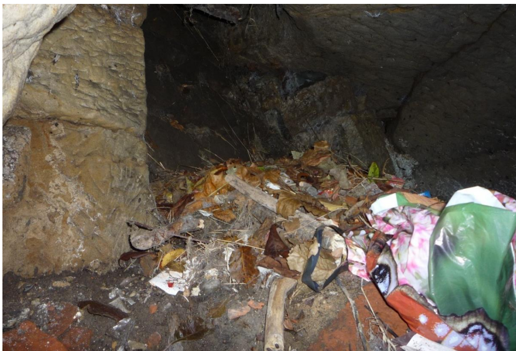
Foto č. 39 – Odpadky ve spojovací chodbě mezi sklepy E a F (říjen 2019).