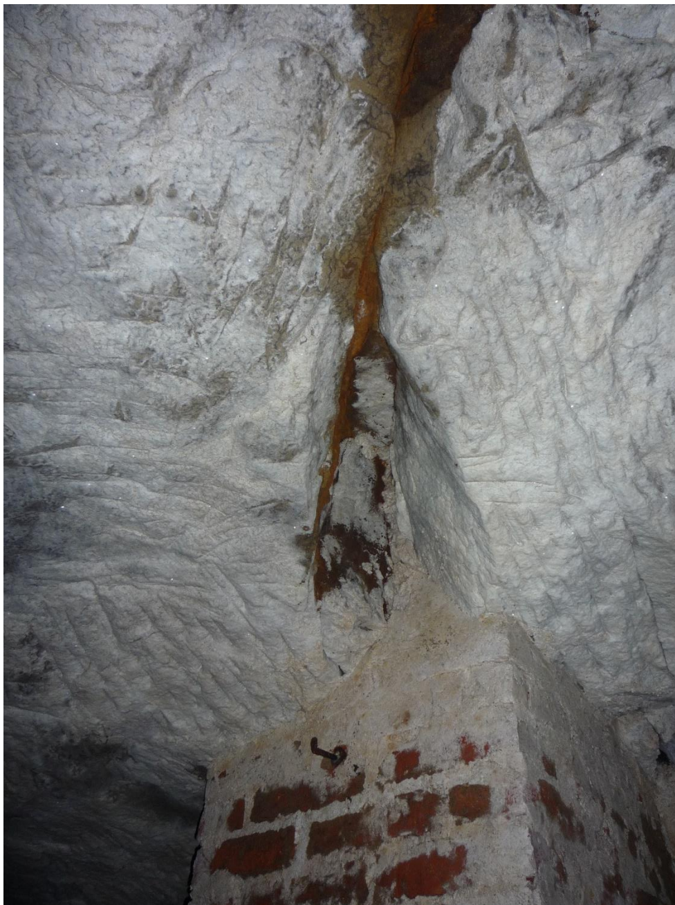
Foto č. 17 – Sklep C, zděný opěrný pilíř pod rozevřenou puklinou.